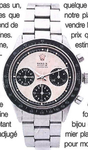
ROLEX Daytona Cosmograph (1964), adjudgé 153 000 €.

Ces histoires se répètent et se ressemblent... Ce fut encore le