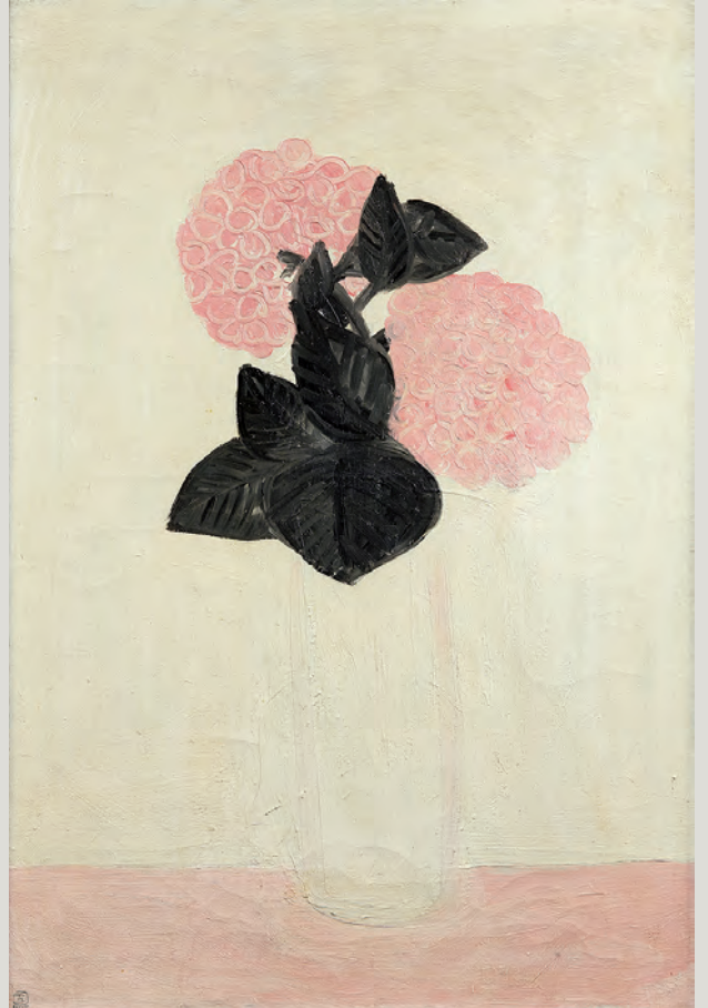
116 – Sanyu, adjudgé 4 080 000 €