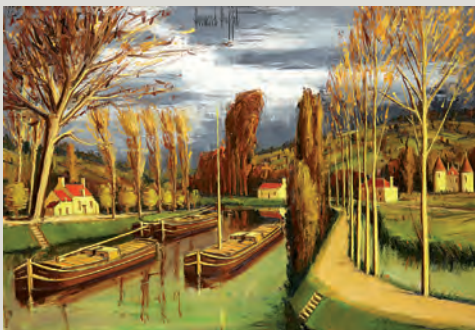
133 – Bernard Buffet, adjugé 127 680 €