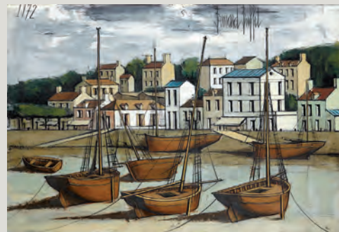
128 – Bernard Buffet, adjugé 206 150 €