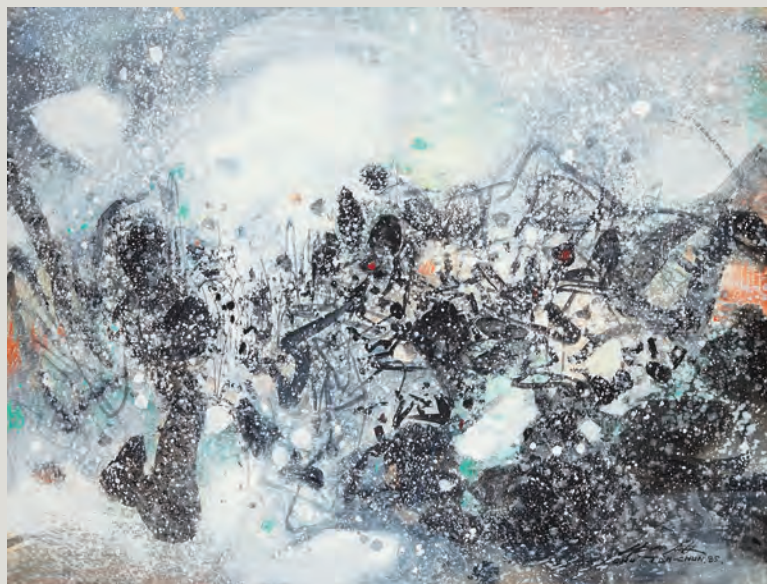
2- Chu The-Chun, adjugé 280 500 €

Bernard BUFFET (1928-1999), autre grand gagnant de la vente, a totalisé 1,139 millions avec neuf huiles sur toile. Acquises pour la plupart dans les années 1970 par plusieurs collectionneurs et conservées depuis, on y retrouve les variations – la mer et les bateaux, les natures mortes, les paysages urbains ou ruraux – chères au peintre farouche et incisif dont Jean Cocteau vantait « l'étonnante écriture de mante religieuse ». Les plus belles enchères :