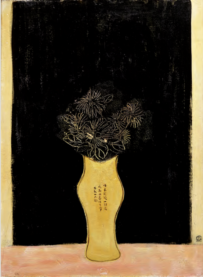
115 – Sanyu, adjudgé 4 080 000 €