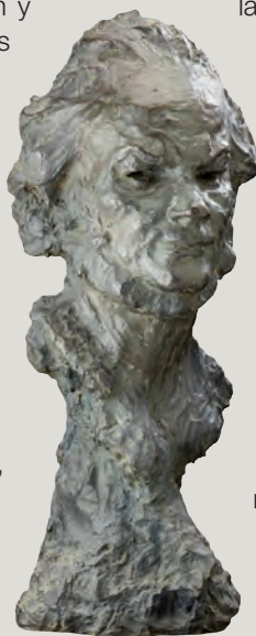
173 – Bronze Daumier, adjugé 61 200 €

On a noté une importante participation d'enchérisseurs étrangers dans la salle, au téléphone ou également sur Drouot live. Les enchères se sont succédées, en accord avec la côte internationale, pour une huile de Zao Wou-Ki (Lot 1 - 535 500 €), Chu Teh-Chun (Lot 2 - 280 500 € et 140 250 €), Valerio Adami (25 500 €), Arman ( Violoncelle , 26 775 €) ou encore par exemple Jonone ( Hôpital éphémère , 42 560 €). Signalons également les 61 200 € obtenus pour un bronze, autoportrait d'Honoré Daumier (Lot 173). Les acheteurs ont été pour la plupart asiatiques ou occidentaux.