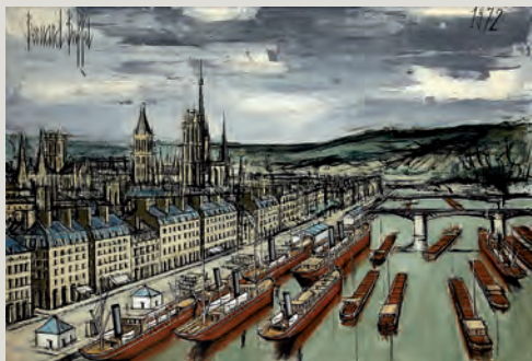
127 – Bernard Buffet, adjugé 331 500 €