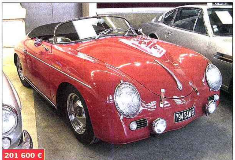
▲ La rare version Speedster de la Porsche 356 a fait plus cher à Lyon-Brotteaux que dans bien des ventes américaines.