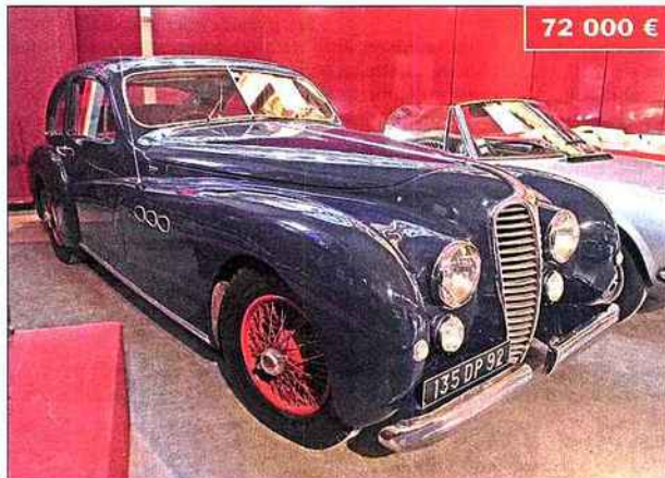
◀ Ce coach Delahaye 135 M de 1950 demande un rafraîchissement, mais la signature de Vanvooren a joué en sa faveur.

Ces prix s'entendent frais et TVA compris (20 %). REST : véhicule restauré (+ ou - bien), OR : état d'origine (+ ou - bon), RAR : restauration ancienne à reprendre, TR : véhicule transformé ou modifié au cours de sa carrière