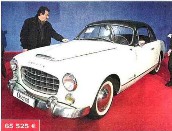
Prix record pour cette Ford Comète Monte-Carlo qui part à l'étranger. ▶