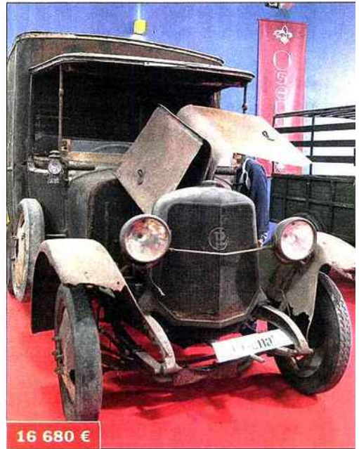
En quoi cet utilitaire Panhard X 25 de 1914 sera-t-il reconditionné ? ▶