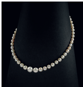
Collier de 58 perles fines Adjugé 344 000 € ttc (lot 88 du 24/06)