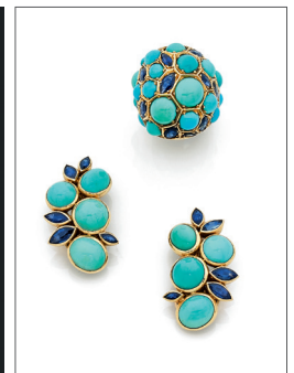
Ensemble Suzanne BERPERRON Adjugé 81 000 € ttc (lot 117 du 24/06)

Nous avons vendu cette année plus de 100 colliers et autres pièces composées de perles fines dont notre Maison de vente a fait sa spécialité. En valeur, 98% de ces ventes ont été réalisées avec des acheteurs étrangers qui démontrent ainsi notre notoriété internationale sur ce secteur.