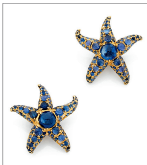
René BOIVIN Adjugé 57 000 € ttc (lot 174 du 24/06)