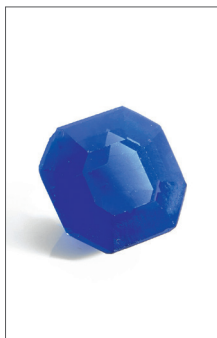
Saphir Cachemire Adjugé 53 000 € ttc (lot 77 du 15/10)

Alors que la SVV Aguttes confirme sa position de 4ème maison de vente française en 2015 (classement Figaro 18/12/15) avec un total adjugé de 41.5 Millions d'euros ttc, le département Bijoux et Horlogerie conforte sa progression et annonce un total de 5.3 Millions d'Euros ttc.