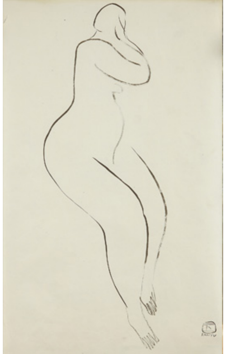
常玉 (1901-1966) 裸女 水墨 45 x 27 厘米