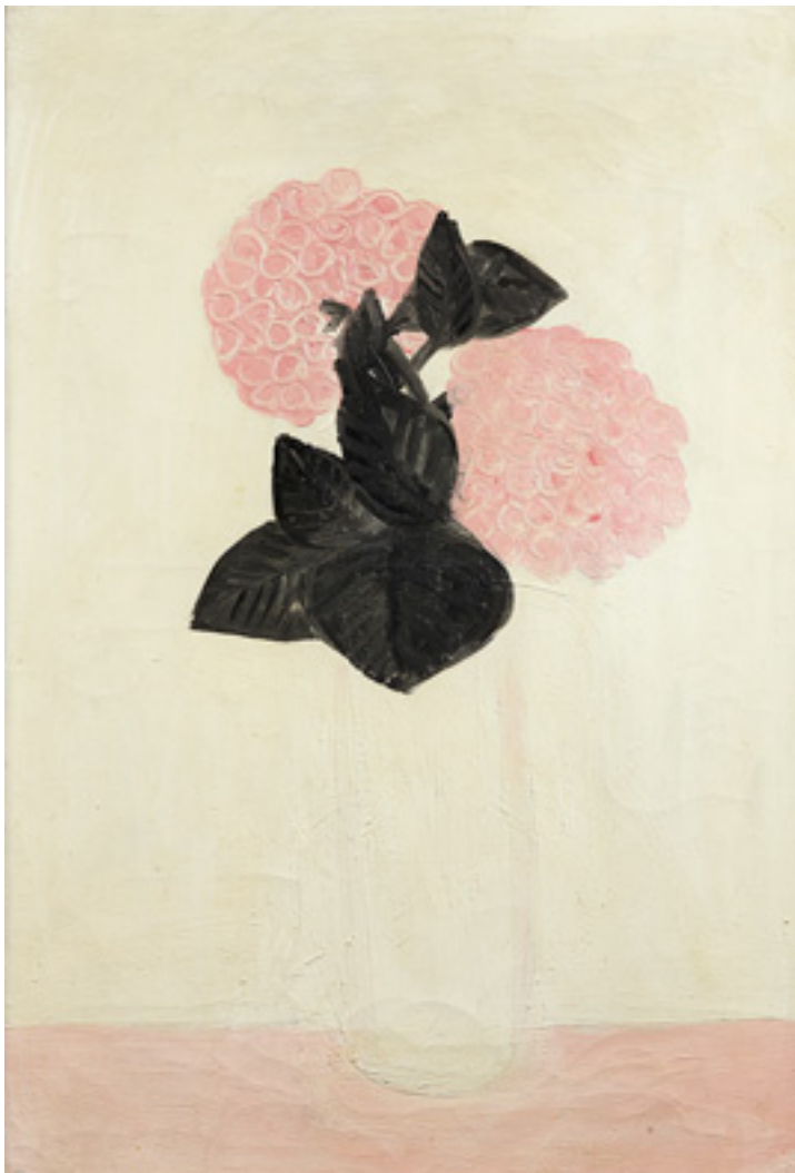
常玉 (1901-1966) 白花瓶内的两朵大绣球花 1931年2月 布面 油画 73 x 50 厘米