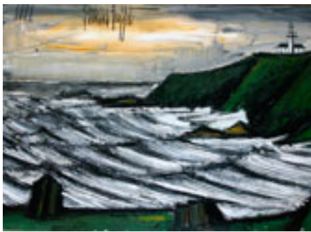
贝尔纳·布菲 (Bernard BUFFET, 1928-1999) 布岚岬角浪涛 1991年 布面油画 81 x 116 厘米