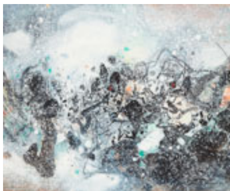
朱德群 (1920-2014) 抽象 I, 1985 布面丙烯, 布面托裱 49.5 x 65 厘米