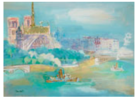
Jean DUFY (1888-1964) 圣母院教堂半圆形后殿, 约 1950-1953 年 水彩 和 水粉画 44.5 x 61 厘米

在线浏览图录: www.aguttes.com 在线实时竞拍: www.drouotlive.com