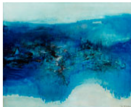
赵无极 (1920-2013) 27.4.69 布面油画 46 x 55 厘米