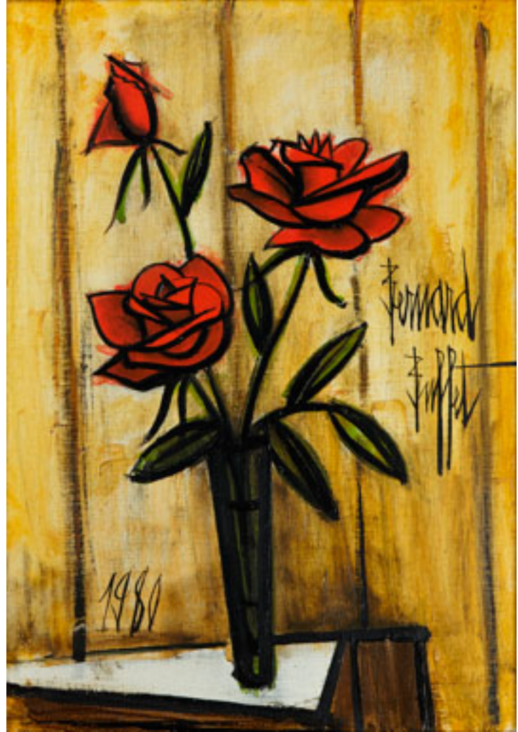
贝尔纳·布菲 (Bernard BUFFET, 1928-1999) 玫瑰, 1980年 布面油画 65 x 46 厘米