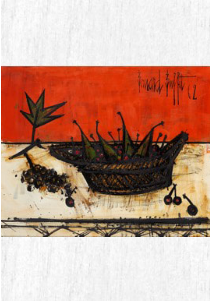
贝尔纳·布菲 (Bernard BUFFET, 1928-1999) 静物, 梨, 1962年 布面油画 60 x 73 厘米