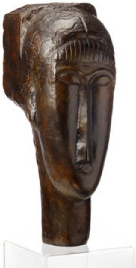
阿梅代奥·莫迪利亚尼(Amedeo Modigliani, 1884-1920) 艺术家去世 后发行版本, 带花体签名缩写 JM. IV/IV 高 50 厘米