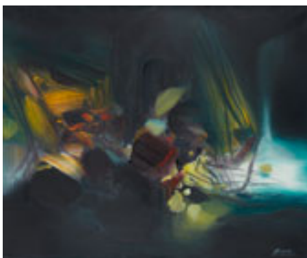
朱德群 (1920-2014) 构图, 5.12.1975 布面油画 60 x 73 厘米