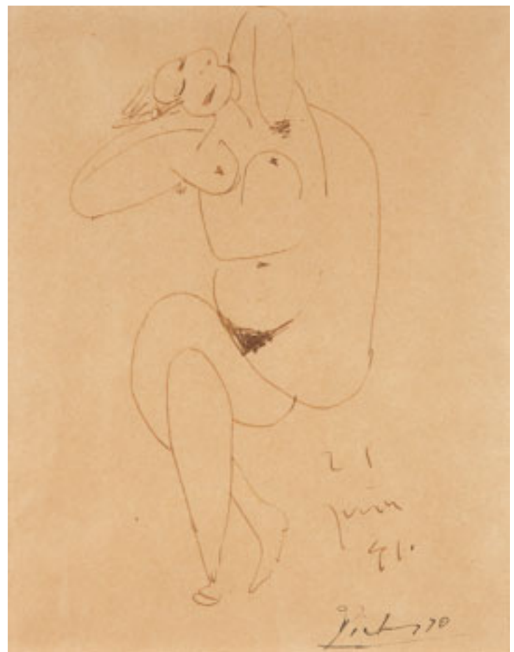
巴勃罗·毕加索(Pablo PICASSO, 1881-1973) Dora Maar , 1941年6月21日 纸面水墨 27 x 21 厘米