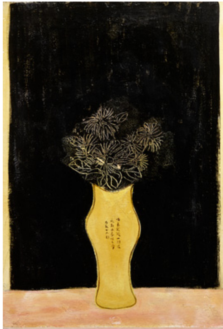
常玉 (1901-1966) 瓶花 带艺术家签名, 1930年代 布面 油画 72 x 53.5 厘米