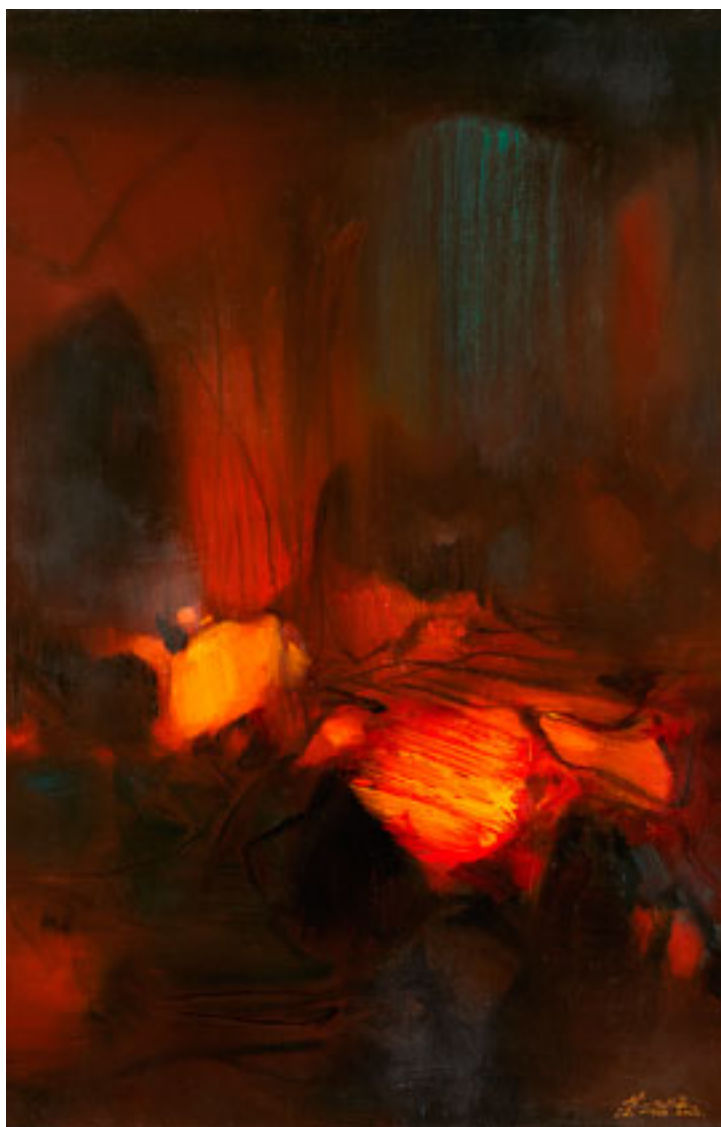
朱德群 (1920-2014) 构图, 18.2.1978 布面油画 80 x 60 厘米