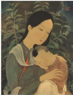
Le Pho Adjugé 471 750 €