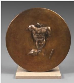
Igor Mitoraj Adjugé 38 250 €