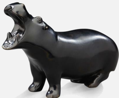
Lot 135 – François Pompon Hippopotame 20 000 / 30 000 €