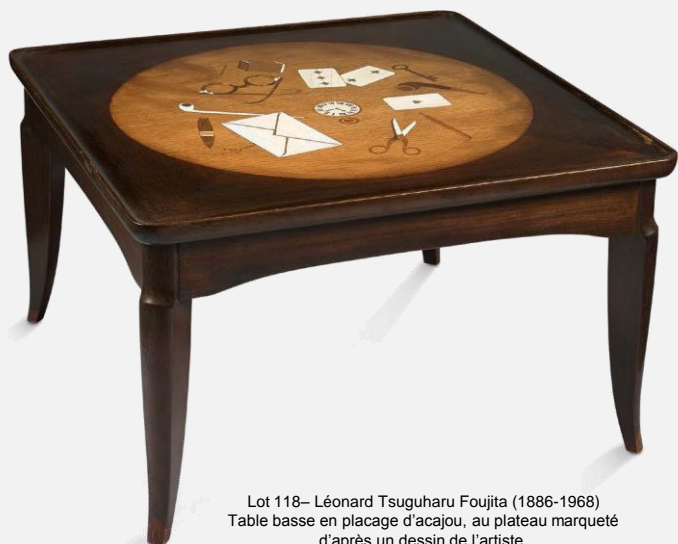
Lot 118– Léonard Tsuguharu Foujita (1886-1968) Table basse en placage d'acajou, au plateau marqueté d'après un dessin de l'artiste. 10 000 / 15 000 €

C'est à cette période que Foujita naît à Tokyo en 1886 : il commence ses études à l'Ecole des beaux-arts de Tokyo dans la section de peinture européenne (instituée avec l'occidentalisation de la peinture pendant la période Meiji), avant de s'installer à Paris, en 1913. Là, il participe à la grande effervescence de Montparnasse, dont il devient l'une des vedettes avec son style à la fois italianisant et japonisant, parfait exemple de l'hybridation culturelle de l'époque. Foujita a également collaboré avec de célèbres ébénistes comme Jules Leleu lors de l'ameublement du paquebot Normandie.