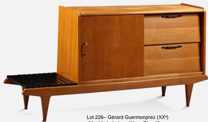
Lot 226– Gérard Guermonprez (XX e ) Meuble bahut modèle « Chantilly » 1 200 / 1 500 €

Le meuble bahut « Chantilly » de Gérard Guermonprez est également une excellente illustration d'un certain design français des années 1950 : une recherche de fonctionnalité et d'élégance traduite par la porte coulissante découvrant un intérieur compartimenté ainsi que par les deux tirettes à abattant légèrement renforcées. Original par son asymétrie, le bahut est flanqué d'un espace qui n'oublie pas d'être fonctionnel car il peut servir d'assise ou de tablette de présentation.