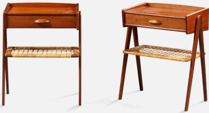
Lot 251– Kurt Ostervig, dans le goût, vers 1960 800 / 1 000 €

Cap au nord avec le design Scandinave et cette mignonne paire de chevets dans le goût de Kurt Ostervig qui sera de mise à la ville, comme à la campagne, avec cette alliance élégante de tek et de rotin.