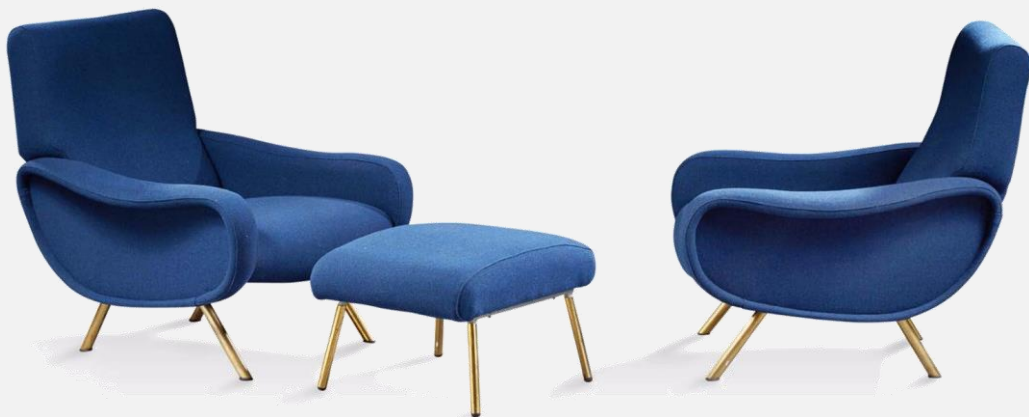
Lot 269 – Marco Zanuso (1916-2001) Paire de fauteuils modèle « Lady », Vers 1960 4 000 / 6 000 €

Achevons notre voyage avec le design italien , en nous abandonnant dans ce fauteuil modèle « Lady » signé Marco Zanuso , qui nous tend des bras accueillants pour un (grand) repos mérité.