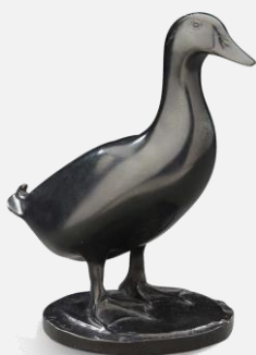
Lot 134 – François Pompon Canard 8 000 / 12 000 €

"J'aime la sculpture sans trou ni ombre" se plaisait à dire le Maître. Nous aussi, on aime !