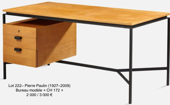
Lot 222– Pierre Paulin (1927–2009) Bureau modèle « CH 172 » 2 000 / 3 000 €

En France tout d'abord , attardons-nous sur un bureau en bois et métal laqué noir signé Pierre Paulin vers 1950. L'exposition de 2016, au Centre Georges Pompidou, a particulièrement mis en avant la créativité du designer dans son emploi innovant du jersey, un tissu extensible, donnant naissance dans les années 1960-1970 aux fauteuils-icône que sont Ribbon, Mushroom, etc... Le bureau CH 172 fait partie du travail qu'il réalise un peu plus tôt, dans les années 1950, en collaboration avec l'éditeur Thonet France, dans un style très inspiré du design scandinave. Un meuble fonctionnel, aérien, parfaitement dans l'air du temps.