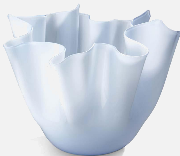
Lot 224 – Venini Vase Fazzoletto, 1993 8 000 / 1 000 €