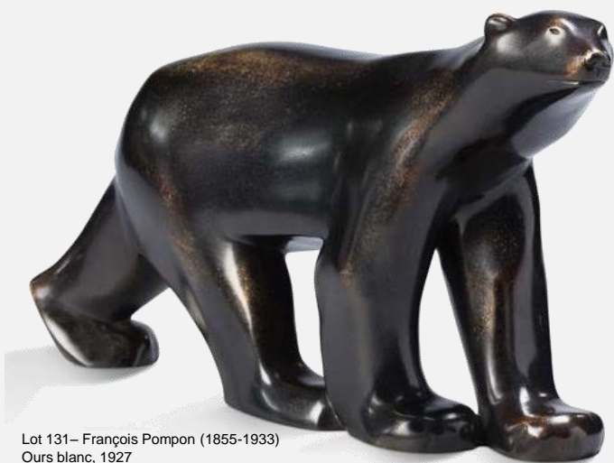
Lot 131 – François Pompon (1855-1933) Ours blanc, 1927 120 000 / 150 000 €

En 1922, son Ours blanc , présenté au Salon d'Automne lui vaut une célébrité tardive. D'une ligne pleine et simple, cet ours séduit le connaisseur comme le profane : il incarne la forme universelle, presque évidente, de ce que l'on se représente être un ours.