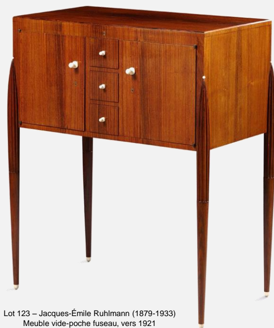
Lot 123 – Jacques-Émile Ruhlmann (1879-1933) Meuble vide-poche fuseau, vers 1921 100 000 / 150 000 €

S'il est un créateur qui a marqué l'histoire des arts décoratifs des années 1920-1930, c'est bien Jacques-Émile Ruhlmann : cet autodidacte n'a jamais été formé au métier d'ébéniste, mais il a révolutionné la ligne du mobilier de l'époque lui insufflant par ses dessins un style épuré, élégant et aérien. Il fait travailler par les meilleurs ébénistes de l'époque les bois précieux comme la palissandre et le macassar et leur fait exécuter le célèbre pied fuseau qu'il a créé en 1921 : cannelé de huit sillons, il demande 24 heures de travail et, placé sur le flanc des meubles, il accentue l'impression de légèreté. Le Vide-poche Fuseau inclus à notre catalogue est une pièce d'exception, très représentative du travail de Ruhlmann et proche du modèle en ébène de Macassar conservé au Musée des Arts-Décoratifs de Lyon. Celui que nous présentons est en placage de palissandre sur toutes les faces et comporte en façade, sur la tablette au dos et aux pieds des éléments d'ivoire. Flanké des fameux pieds fuseaux, cette pièce de niveau muséal sera pour son futur acquéreur un meuble de grande élégance.