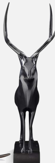
Lot 132 – François Pompon Le grand cerf 20 000 / 25 000 €