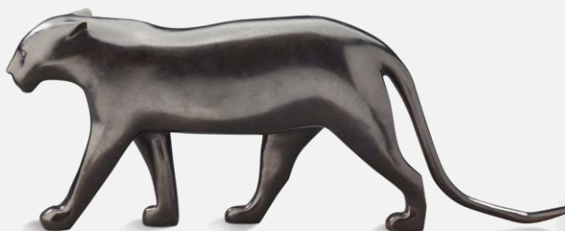
Lot 133 – François Pompon Panthère noire 10 000 / 15 000 €