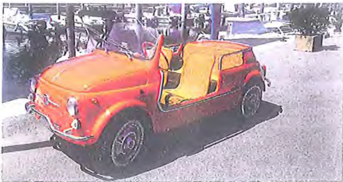
Fiat 500 D Jolly Beach

Jamais en reste, Maserati peut s'appuyer sur les inconditionnels de la marque, d'autant plus que la cote de ses modèles semble réellement à la hausse. Un modèle Sebring 3700 de 1969 confirmait son estimation à 120 000/140 000 € pour être emporté au final à 120 000 € (frais compris). Autre « star » des salons de collectionneurs, la fameuse Aston Martin Vanquish consciemment ou inconsciemment toujours associée à James Bond. De millésime 2003, équipé du fameux 12 cylindres en V et avec seulement 25 230 km au compteur, ce sublime et ultra performant bolide de couleur grise trouvait