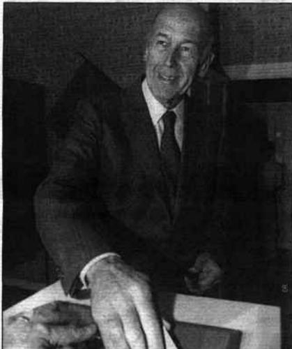
Valéry Giscard d'Estaing, président de la République Française et propriétaire du château de la Varvasse, a voté pendant des décennies à Chanonat.