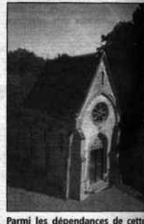
Parmi les dépendances de cette bâtisse propriété de la famille Giscard d'Estaing depuis 80 ans, une chapelle.

le dernier empereur du Viet-Nam. Même Jacques Chirac fut invité de La Varvasse. Les 1 500 habitants de cette commune voient également partir le propriétaire avec une certaine nostalgie mais aussi une ancienne conseillère municipale : l'ancienne première dame de France - Anne-Aymone - Giscard d'Estaing avait occupé la fonction de conseillère municipale de 1983 à 1995. Le père de l'ancien président, premier propriétaire de la maison familiale, a lui été le maire de cette commune de 1932 à 1947. L'attachement de Valéry Giscard d'Estaing à la commune de Chanonat était encore visible lors de l'élection présidentielle de mai dernier. L'ancien président avait voté à la salle des fêtes avec les 1 042 autres inscrits.