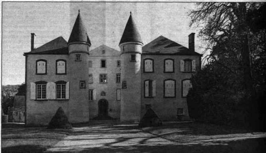
Le château de La Varvasse, demeure de VGE, accueille une vente aux enchères de plusieurs jours à partir du vendredi 28 septembre, à Chanonat.

C'est ce dernier qui a commencé à meubler cette demeure médiévale dans un style très classique. Les quatre cents lots mis en vente datent du XVII e siècle à Napoléon III. Parmi les plus belles pièces : des tapisseries d'Aubusson et de Bruxelles et une collection de faïences fabriquées à Allagnat. Une pendule de Lepante, époque Empire, achetée chez Sotheby's en 2004 en provenance des collections Fabius fait aussi partie des plus belles œuvres de cette vente aux enchères. Le produit de la vente servira à l'installation de la fondation de Valéry Giscard d'Estaing dans le château aveyronnais d'Estaing. Les objets plus personnels ont naturellement été conservés par la famille.