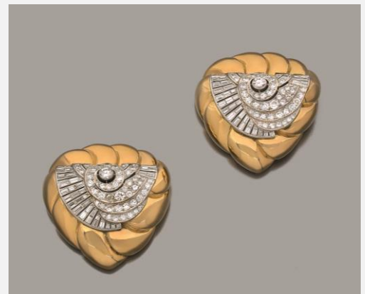
Suzanne Belperron, Grande paire de clips, avant 1955. Adjugée 56 100 €

Note : Tous les prix énoncés sont frais inclus