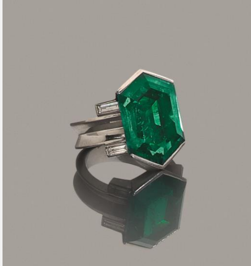
Bague en platine, sertie d'une importante émeraude Adjugée 765 000 €