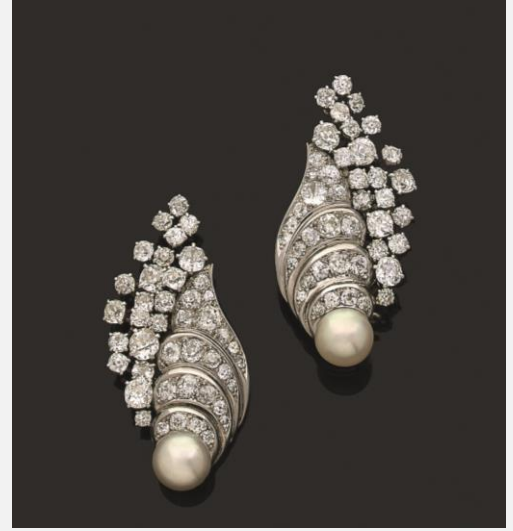
René Boivin, Grande paire de clips d'oreilles Adjugée 70 125 €